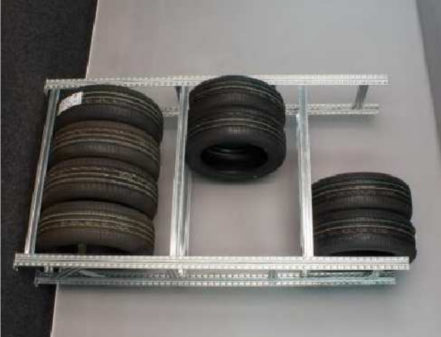
ILUSTRAČNÍ FOTO 3g