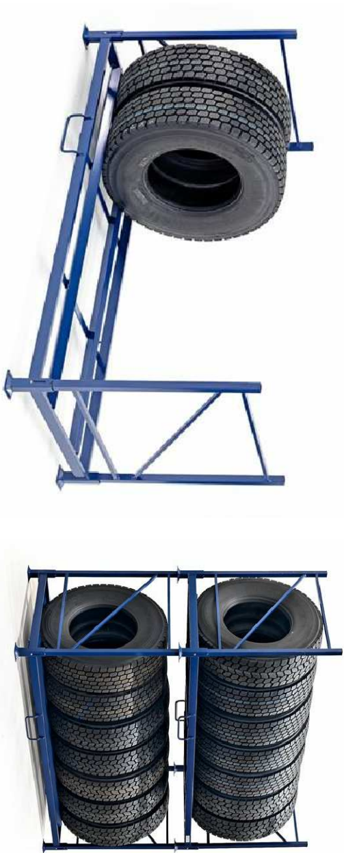
ILUSTRAČNÍ FOTO 3f